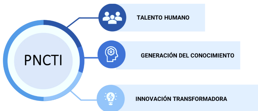
Figura 1 Áreas Estratégicas PNCTI

Con la finalidad de dar a conocer los resultados anuales del 2023 del PNCTI, se emite el presente informe, en el cual se detalla el cumplimiento en las metas de las intervenciones estratégicas.