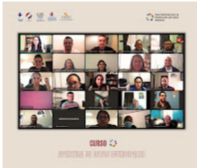
capacitación 1.jpeg 216K