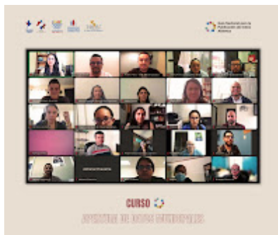
capacitación 1.jpeg 216K