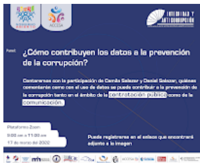
Invitacion-01 (1) (1).png 417K