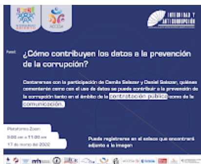
Invitacion-01 (1) (1).png 417K