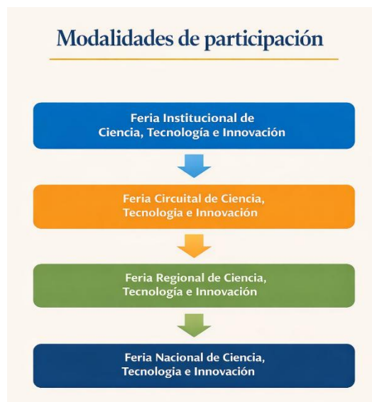
Figura 1 Modalidades de participación (etapas) en las Ferias de Ciencia, Tecnología e Innovación