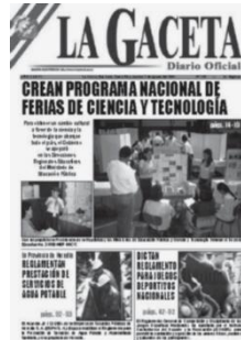
Figura 4 Portada Gaceta No. 150. Decreto 31900 MEP-Micit

El 3 de agosto se publica en la Gaceta No.150, el Decreto Ejecutivo No. 31900 MEP-MICIT, mediante el cual se formaliza la creación del Programa Nacional de Ferias de Ciencia y Tecnología (Pronafecyt), sus objetivos, e instituciones responsables.