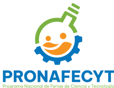
Figura 6 Logo vigente de Pronafecyt

Para el 2024 tras un trabajo articulado con el TEC mediante asistencia estudiantil, se elaboró una nueva imagen gráfica que se oficializa para el Programa Nacional de Ferias de Ciencia y Tecnología y que incluye la implementación de un nuevo logotipo: