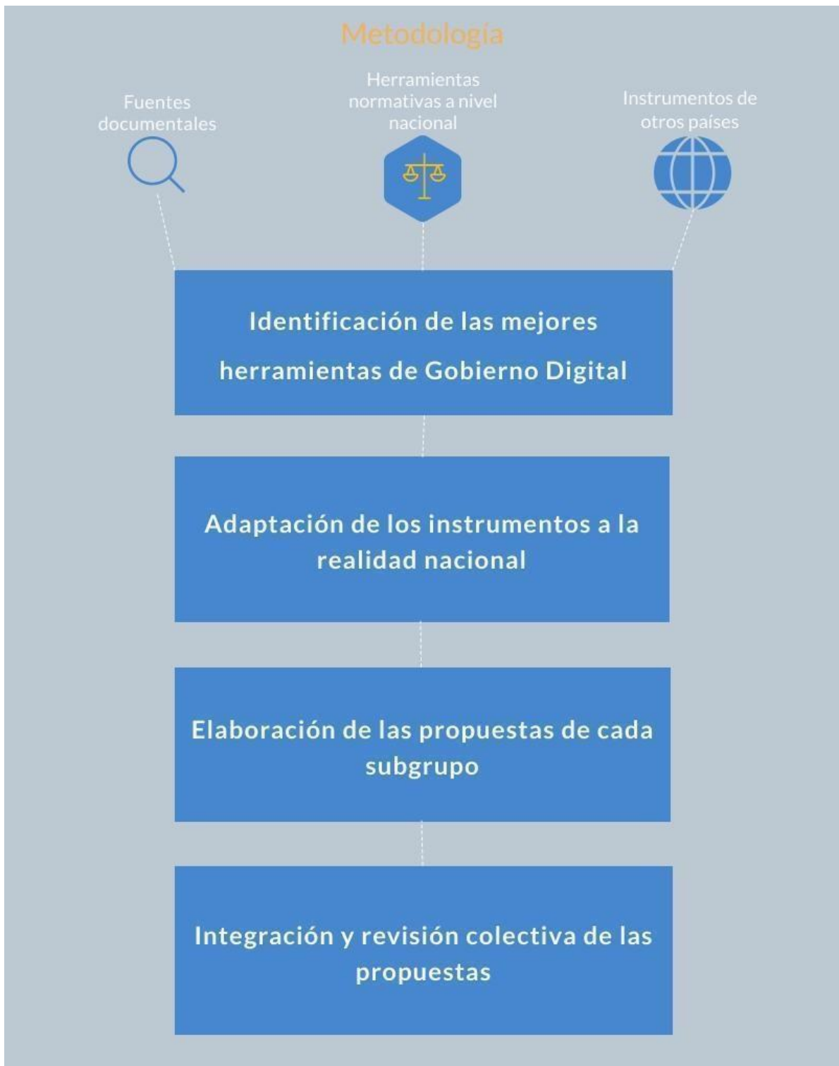
Ilustración 1. Elaboración propia, 2019.