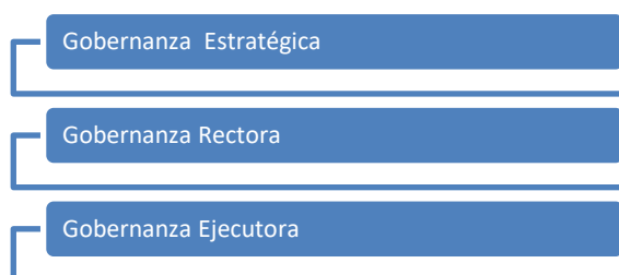
Ilustración 4.

Para la implementación de la interoperabilidad es necesario contar con canales de comunicación para que los diferentes sectores puedan brindar sus insumos y necesidades de servicios digitales. Al mismo tiempo, se debe contar con contactos dentro de las diferentes instituciones como enlaces que puedan coordinar con el MICITT y la DGDCFD, y coordinar las implementaciones técnicas.