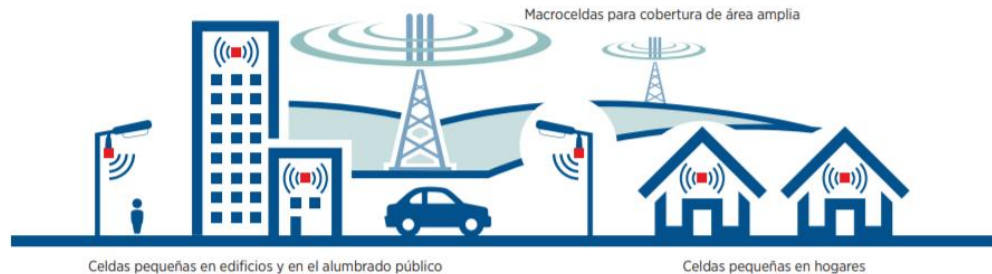
REPRESENTACIÓN DE UNA RED MÓVIL 4G/5G