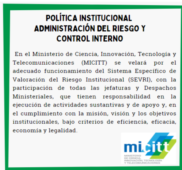
Figura 1. Política Institucional Administración del Riesgo y Control Interno 2019

Esta política fue incluida en el PEI 2019-2025 y posteriormente cuando se realizó el proceso de revisión y ajuste a ese documento, se volvió a incorporar en el PEI 2021-2023.